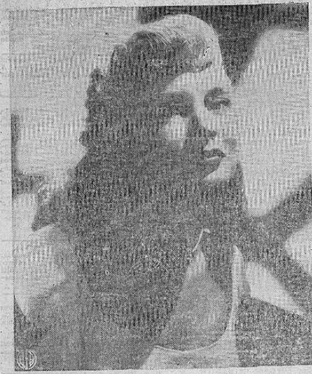
COLLAR DE DIAMANTES — Janet Leigh de Hollywood luce una mariposa de joyas en un collar de diamantes que lleva en el cuello. Las alas de la mariposa son flexibles y se ondean en la luz que refleja el brillo de los diamantes.