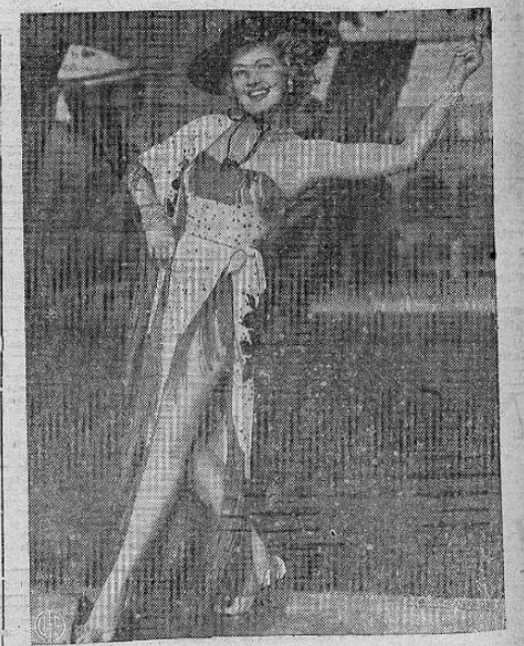
BETTY GRABLE DE ESPAÑOLA — Aquí vemos a la bella actriz norteamericana Betty Grable vestida de señorita española para su próxima película titulada "Cuando mi nene se sonrie conmigo".